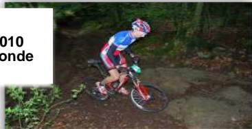
T. VASSAL Vainqueur GM 2010 Champion du monde 2009